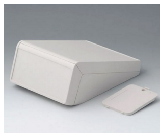
B4056227 UNITEC M, 1,4/0,6 АБС (UL 94 HB) белый RAL 9002 148x210x80mm IP 40