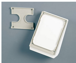
B4154307 Набор для настенного монтажа S белый RAL 9002