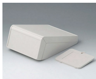
B4056327 UNITEC M, 1,4/0,6 АБС (UL 94 HB) белый RAL 9002 148x210x80mm IP 40