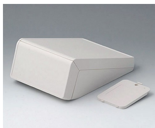
B4056207 UNITEC M, 0,6/0,6 АБС (UL 94 HB) белый RAL 9002 148x210x80mm IP 40