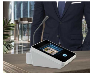
Table microphone / inter phone