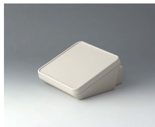
B4414307 PROTEC 140, исп. III АСА+ПК (UL 94 V-0) белый RAL 9002 140x160x76mm IP 65 opt.