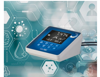
Laboratory measuring device