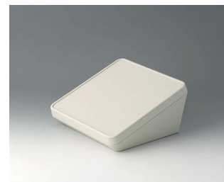
B4418107 PROTEC 180, исп. I АСА+ПК (UL 94 V-0) белый RAL 9002 180x180x92mm IP 65 opt.