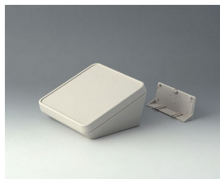
B4414207 PROTEC 140, исп. II АСА+ПК (UL 94 V-0) белый RAL 9002 140x140x76mm IP 65 opt.