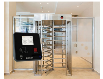
Terminal for access control