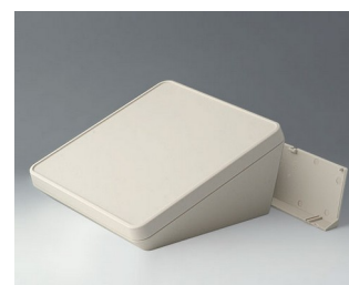
B4422207 PROTEC 220, исп. II АСА+ПК (UL 94 V-0) белый RAL 9002 220x220x108mm IP 65 opt.