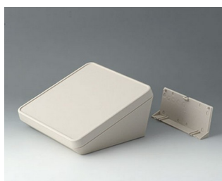
B4418207 PROTEC 180, исп. II АСА+ПК (UL 94 V-0) белый RAL 9002 180x180x92mm IP 65 opt.