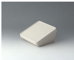
B4414107 PROTEC 140, исп. I АСА+ПК (UL 94 V-0) белый RAL 9002 140x140x76mm IP 65 opt.