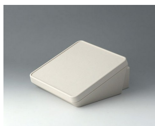
B4418307 PROTEC 180, исп. III АСА+ПК (UL 94 V-0) белый RAL 9002 180x201x92mm IP 65 opt.