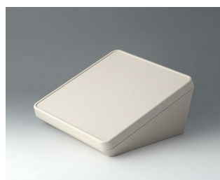
B4422107 PROTEC 220, исп. I АСА+ПК (UL 94 V-0) белый RAL 9002 220x220x108mm IP 65 opt.