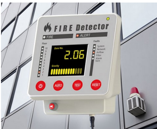
Terminal for fire alarm systems