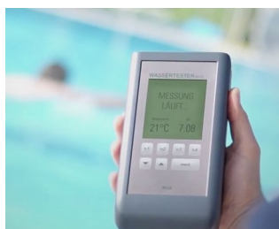
Electronic pool tester