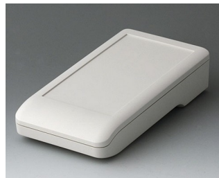
A9006117 DATEC-COMPACT M АСА+ПК (UL 94 V-0) белый RAL 9002 172x92x39mm IP 41