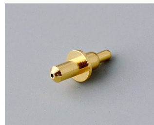
A9193031 Пружинный контакт позолоченный