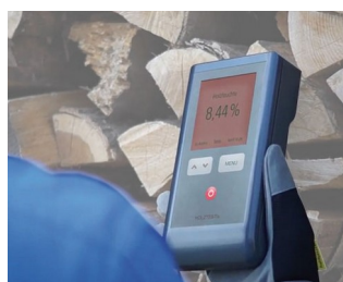
Wood moisture measuring device