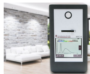
Spectral light meter