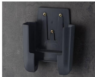
A9107628 Настенный держатель L АСА+ПК (UL 94 V-0) лава