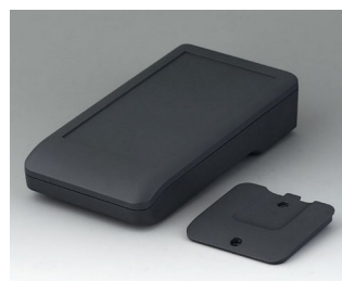
A9006218 DATEC-COMPACT M АСА+ПК (UL 94 V-0) лава 172x92x39mm IP 41