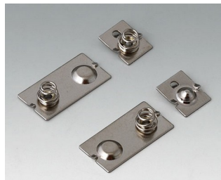
A9190024 Набор батарейных контактов, 3 x AAA Сталь никелированный