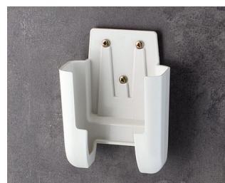
A9106627 Настенный держатель M ACA+ПК (UL 94 V-0) белый RAL 9002