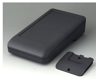
A9007218 DATEC-COMPACT L АСА+ПК (UL 94 V-0) лава 206x110x47mm IP 41