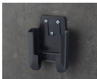
A9105628 Настенный держатель S ACA+ПК (UL 94 V-0) лава