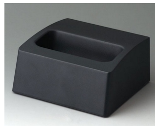
A9106508 База M АСА+ПК (UL 94 V-0) лава