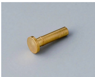
A9193030 Контактная площадка позолоченный