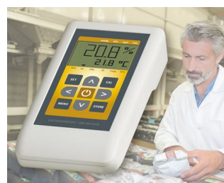
Газоанализатор кислорода в воздухе