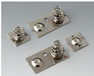
A9190023 Набор батарейных контактов, 3 x AA Сталь никелированный