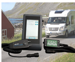
System for leak detection in leisure vehicles