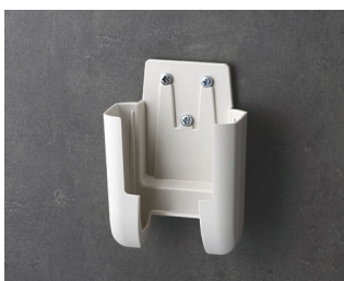
A9105627 Настенный держатель S ACA+ПК (UL 94 V-0) белый RAL 9002