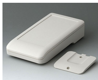
A9006217 DATEC-COMPACT M АСА+ПК (UL 94 V-0) белый RAL 9002 172x92x39mm IP 41