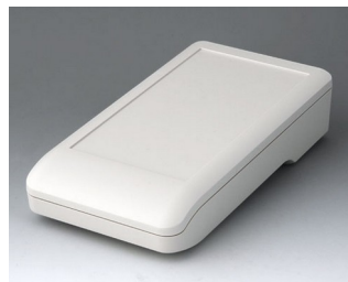
A9007117 DATEC-COMPACT L АСА+ПК (UL 94 V-0) белый RAL 9002 206x110x47mm IP 41