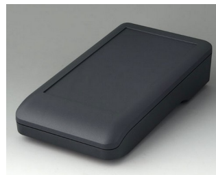
A9007118 DATEC-COMPACT L АСА+ПК (UL 94 V-0) лава 206x110x47mm IP 41