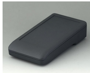
A9006118 DATEC-COMPACT M АСА+ПК (UL 94 V-0) лава 172x92x39mm IP 41