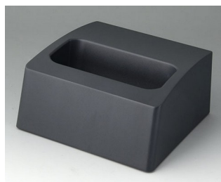
A9107508 База L АСА+ПК (UL 94 V-0) лава