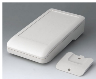
A9007217 DATEC-COMPACT L АСА+ПК (UL 94 V-0) белый RAL 9002 206x110x47mm IP 41