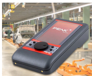
Mobile diagnostic device for CAN and CAN FD buses