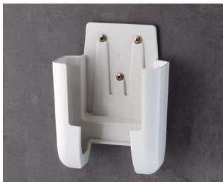
A9107627 Настенный держатель L АСА+ПК (UL 94 V-0) белый RAL 9002