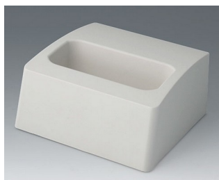
A9107507 База L АСА+ПК (UL 94 V-0) белый RAL 9002