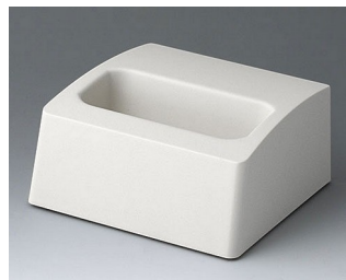
A9106507 База M АСА+ПК (UL 94 V-0) белый RAL 9002