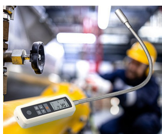
Gas leak detector