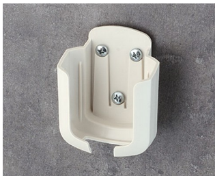
B2931507 Настенный держатель М АСА+ПК (UL 94 V-0) белый RAL 9002