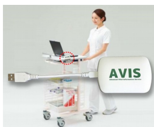
Receiver and data transfer for EMR