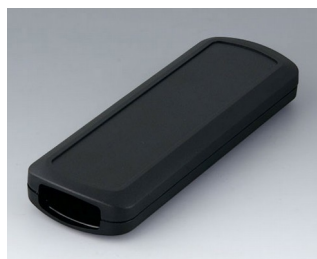
B2834109 CONNECT АСА+ПК-ФР (UL 94 V-0) черный RAL 9005 156x54x22mm