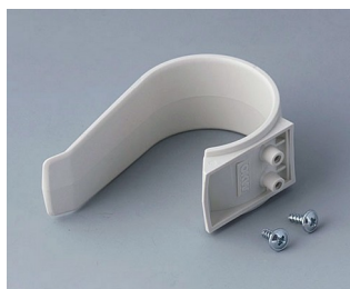
A9167027 Клипса-держатель ПА 6 (UL 94 HB) белый RAL 9002