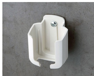
B2921507 Настенный держатель S АСА+ПК (UL 94 V-0) белый RAL 9002