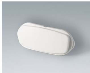
B2811207 Торцевая панель АСА+ПК (UL 94 V-0) белый RAL 9002