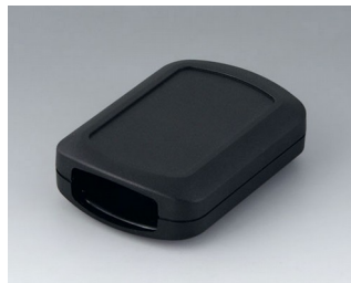
B2832109 CONNECT АСА+ПК-ФР (UL 94 V-0) черный RAL 9005 76x54x22mm