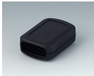
B2822109 CONNECT S АСА+ПК (UL 94 V-0) черный RAL 9005 60x42x22mm