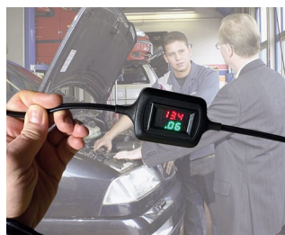
Voltage and current display during trickle charging