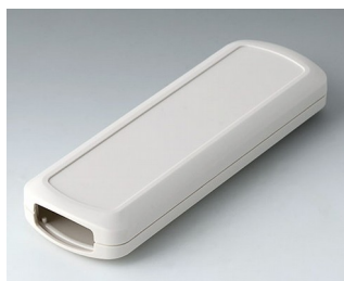
B2834107 CONNECT АСА+ПК-ФР (UL 94 V-0) белый RAL 9002 156x54x22mm