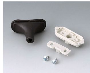
B2911329 Набор для ввода кабеля, 5,0 - 5,9 СЭБС (ТПЭ) черный RAL 9005