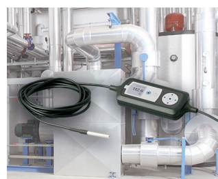
Process monitoring with temperature sensor