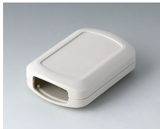
B2832107 CONNECT АСА+ПК-ФР (UL 94 V-0) белый RAL 9002 76x54x22mm