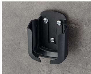
B2931509 Настенный держатель М АСА+ПК (UL 94 V-0) черный RAL 9005