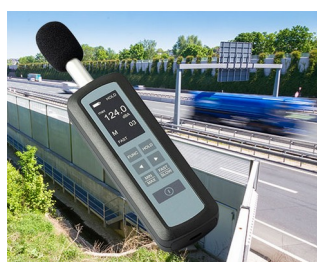
Noise level measurement