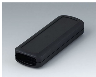
B2824109 CONNECT S АСА+ПК (UL 94 V-0) черный RAL 9005 120x42x22mm