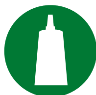
Установка / Сборка аксессуаров