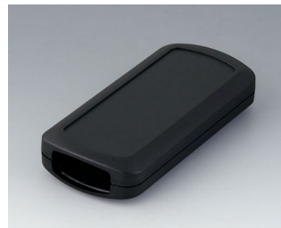
B2833109 CONNECT АСА+ПК-ФР (UL 94 V-0) черный RAL 9005 116x54x22mm