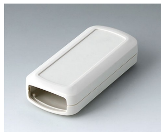
B2823107 CONNECT S ACA+ПК (UL 94 V-0) белый RAL 9002 90x42x22mm