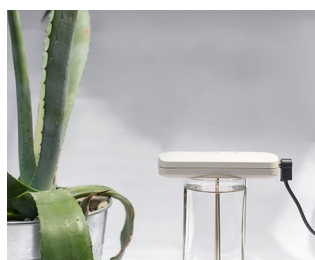
Tool for making colloidal silver solutions