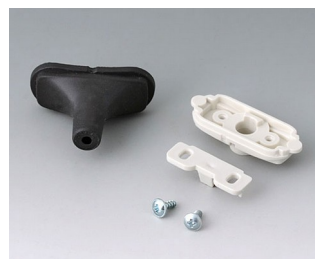
B2911309 Набор для ввода кабеля, 3,4 - 4,2 СЭБС (ТПЭ) черный RAL 9005