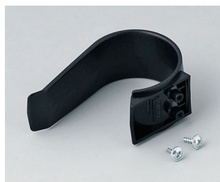
A9167029 Клипса-держатель ПА 6 (UL 94 HB) черный RAL 9005