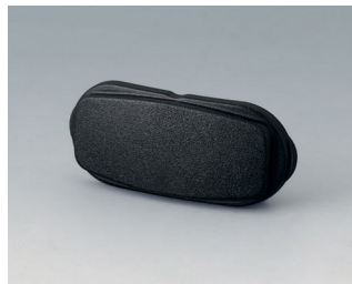
B2811209 Торцевая панель АСА+ПК (UL 94 V-0) черный RAL 9005