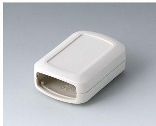
B2822107 CONNECT S АСА+ПК (UL 94 V-0) белый RAL 9002 60x42x22mm