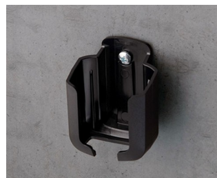
B2921509 Настенный держатель S АСА+ПК (UL 94 V-0) черный RAL 9005