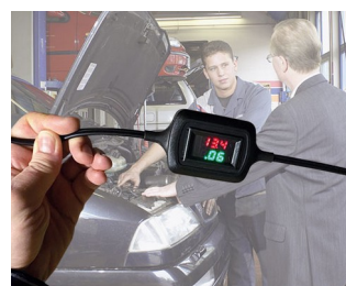
Voltage and current display during trickle charging