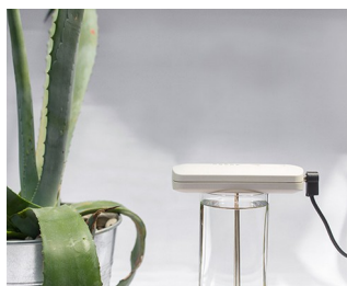
Tool for making colloidal silver solutions