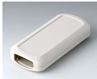
B2833107 CONNECT АСА+ПК-ФР (UL 94 V-0) белый RAL 9002 116x54x22mm