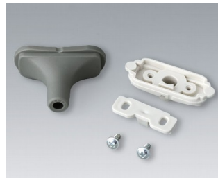
B2911328 Набор для ввода кабеля, 5,0 - 5,9 СЭБС (ТПЭ) вулкан