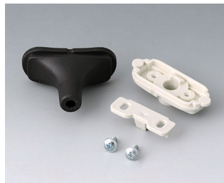
B2911319 Набор для ввода кабеля, 4,2 - 5,0 СЭБС (ТПЭ) черный RAL 9005