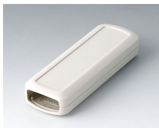
B2824107 CONNECT S АСА+ПК (UL 94 V-0) белый RAL 9002 120x42x22mm