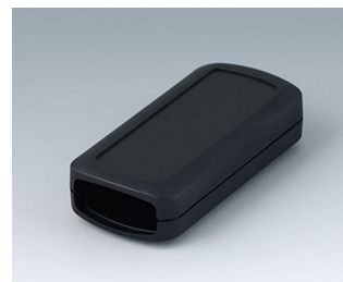
B2823109 CONNECT S ACA+ПК (UL 94 V-0) черный RAL 9005 90x42x22mm