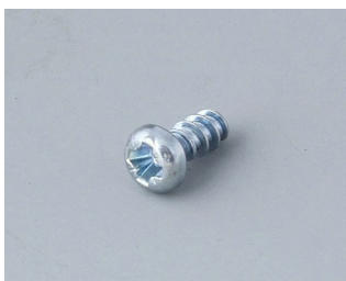
A0304031 Шуруп 2,2 x 5 мм (PZ1)

Возможно внесение изменений без предварительного уведомления. © by OKW Gehäusesysteme, Buchen/Germany.