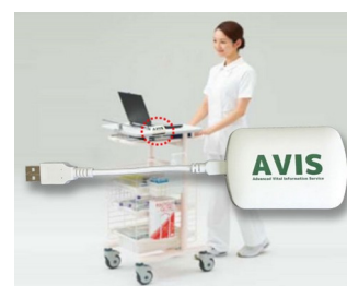
Receiver and data transfer for EMR