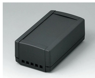
B1050469 TOPTEC 123 H, исп. II АБС (UL 94 HB) черный RAL 9005 123x68x45mm IP 40