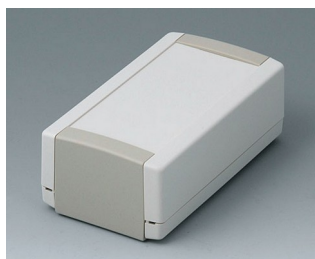
B1050365 TOPTEC 123 H, исп. I АБС (UL 94 HB) белый RAL 9002 123x68x45mm IP 40