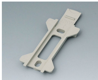
B1350028 Настенный держатель для TOPTEC 123 ПК+АБС (UL 94 V-0) тепло-серый RAL 7032