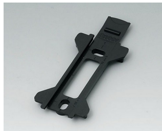
B1350029 Настенный держатель для TOPTEC 123 АБС (UL 94 HB) черный RAL 9005